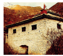
The “Temple Of Miraculous Fire” at Muktinath, Nepal. Photo by Ken Street (Nov. 1979).

And what is more, Jesus Christ will also give you an endless supply of "living water," which will become in you a spring of Eternal Life with God. [For more on this subject, please read our tract The Temple Of Miraculous Fire. ]